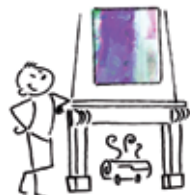
3 · Décorez votre intérieur...