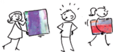
1 · Choisissez votre œuvre...

Pendant un mois et demi, des œuvres de l'artothèque seront exposées à l'Annexe- Mairie pour vous donner l'envie de prolonger une proximité choisie avec elles en les accrochant chez vous pendant une période de trois mois maximum.