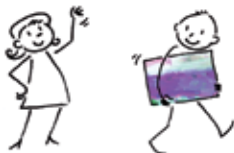
2 · Emportez-la...