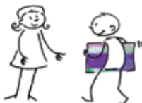
4 · Ramenez votre œuvre...